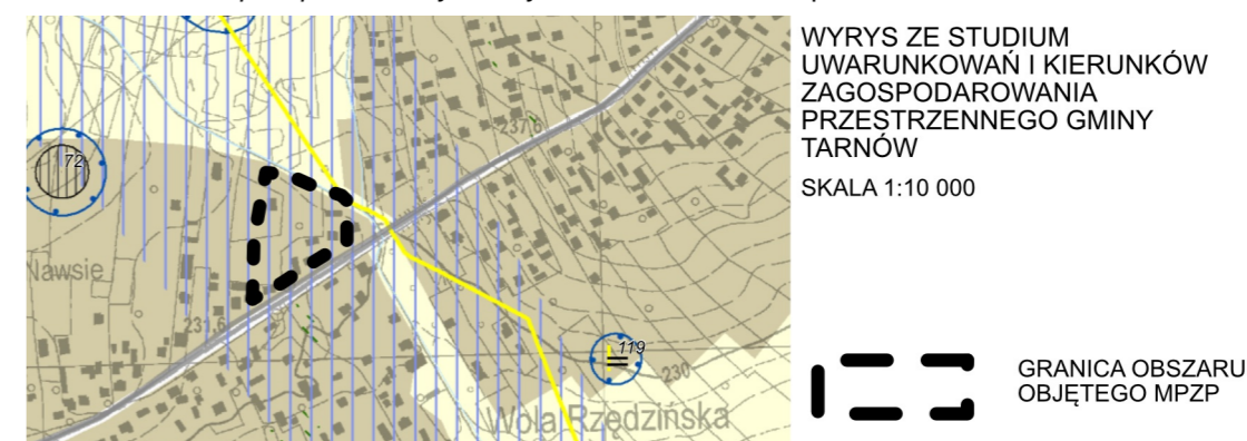
Studium uwarunkowań i kierunków zagospodarowania przestrzennego Gminy Tarnów Uchwała Nr XLIV/607/2023 Rady Gminy Tarnów z dnia 10 sierpnia 2023 r.